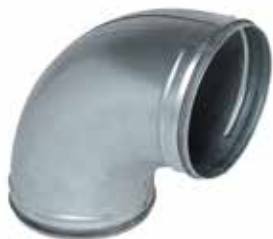
Coude 90° à joints

Le coude 90° à joints permet de changer la direction d'un réseau galvanisé de 90° tout en assurant une étanchéité classe C.