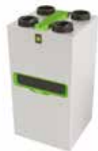
InspirAIR® Top 300 Premium ERV

La solution double flux connectée qui filtre efficacement les polluants les plus fins et s'adapte à vos besoins