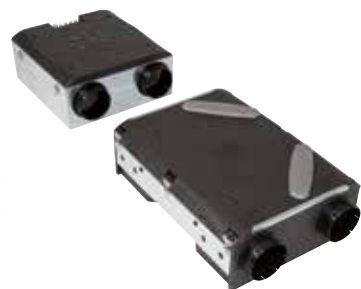
Moto ventilateur Auto

Solution de ventilation double flux modulaire pour s'adapter à toutes les configurations d'installation possibles.