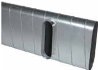
Piquage Droit Oblong sur Plat

Le piquage droit oblong sur plat 90° permet de réaliser un piquage à 90° sur un conduit de type oblong ou rectangulaire galvanisé.