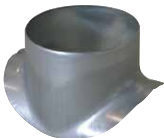
Piquage Equerre Circulaire 90°

Le piquage équerre circulaire permet de réaliser un piquage à 90° sur un conduit circulaire galvanisé.