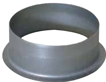
Piquage Equerre sur Plat 90°

Le piquage équerre sur plat permet de réaliser un piquage à 90° sur un conduit de type oblong ou rectangulaire galvanisé.