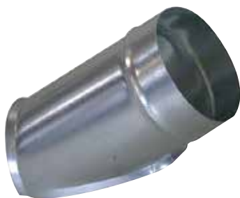
Piquage Oblique Circulaire 45°

Le piquage oblique circulaire permet de réaliser un piquage à 45° sur un conduit circulaire galvanisé.