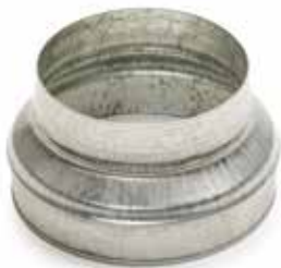
Réduction Conique Concentrique

La RCC permet de raccorder deux conduits galvanisés de diamètres différents entre eux.