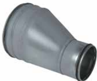
Réduction Conique Excentrée à joints

La RCE à joints permet de raccorder deux conduits galvanisés de diamètres différents entre eux tout en assurant une étanchéité classe C.