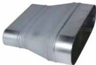
Réduction Concentrique Oblongue

La RCO permet de raccorder deux conduits oblongs de sections différentes.