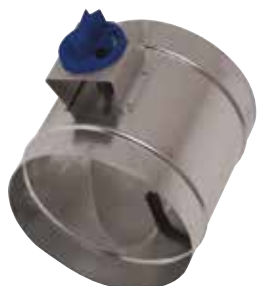
Registre d'Equilibrage en aluminium

Le registre d'équilibrage alu permet de régler la pression dans des branches de réseaux aérauliques en aluminium en bâtiment tertiaire ou collectif.