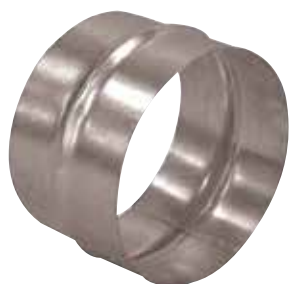
Raccord Mâle en aluminium

Le raccord mâle alu permet de raccorder deux conduits aluminium entre eux.