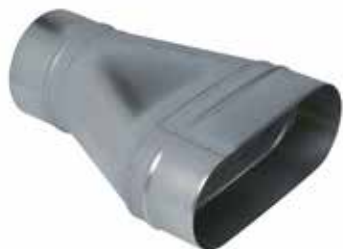
Réduction Oblongue Cylindrique Tangentielle sur Plat

La ROCTP permet de raccorder un réseau oblong à un réseau circulaire tout en conservant un réseau linéaire et plat, sans perte de place vers le bas.