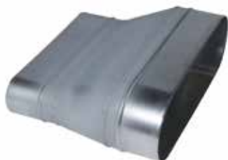
Réduction Oblongue Tangentielle sur Plat

La ROTP permet de raccorder deux conduits oblongs de sections différentes et de conserver un réseau linéaire et plat, sans perte de place vers le bas.