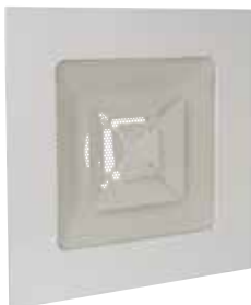
Diffuseur SC 369R

Le SC 369 R est un diffuseur carré à tôle perforée pour la reprise d'air.