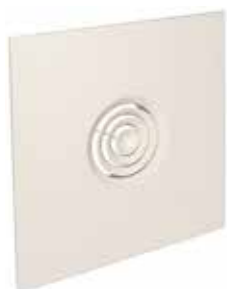
SC 832 TP F0 D200 (AxB=600x600)

Le SC 832 TP est un diffuseur concentrique en acier pour la diffusion d'air fixe et soufflage horizontal, conçu pour remplacer une dalle de plafond standard.