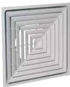
SF704RIF(5) TP F16 D250 (AxB=600x600)

Le SF 704 R TP est un diffuseur carré plafonnier avec 4 directions de soufflage avec plénum intégré pour la diffusion d'air dans les locaux tertiaires.