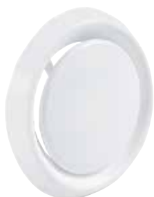
SR 149 D150

La bouche à noyau SR 149 en plastique au débit réglable sur site assure le soufflage ou la reprise d'air.