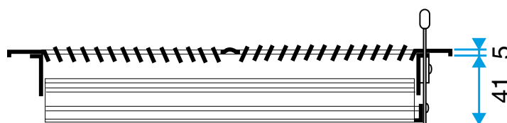
Grille SR 356