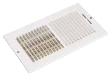
SR 356 F1 203X102

La grille murale emboutie SR 356 permet le soufflage d'air dans un local. Elle est munie d'un registre pour pouvoir régler le débit d'air.