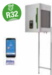
T.One® AIR 08 R32

La solution innovante et sur-mesure pour se chauffer confortablement.