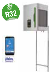
T.One® AIR 08 réversible R32

La solution innovante et sur-mesure pour se chauffer ou rafraîchir son logement confortablement.