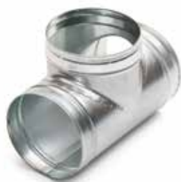
Té Equerre 90°

Le TE 90° permet de raccorder deux branches de réseau galvanisé avec un angle de 90°.