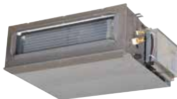
T.One® Horizontal 06 réversible

La solution innovante et sur-mesure pour se chauffer ou rafraîchir son logement confortablement.