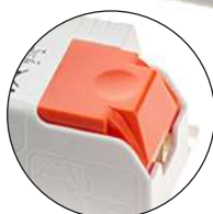
Serre-câble sans vis