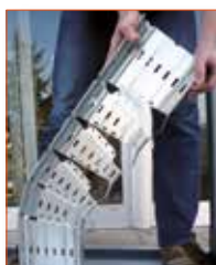
Pliez selon l'angle désiré