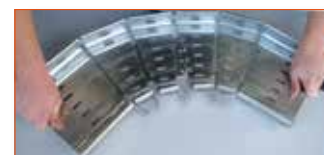
Ajustez éventuellement l'ouverture de l'angle