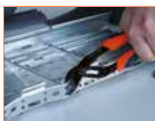
Déformez les ailes à l'aide d'une pince