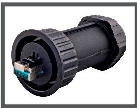
I4PLST6AFSIP68 PLUG DE TERRAIN RJ45 IP68 CAT6A BLINDÉ