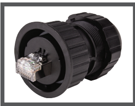
I4PLUGIP68 PLUG RJ45 CAT6A IP68