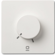
Contrôleur mural rotatif blanc applique RF 6 vitesses