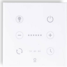
Contrôleur mural blanc pour ventilateur DC avec lumière dimmable