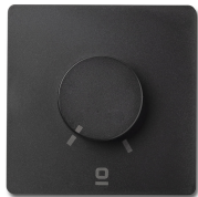
Contrôleur mural rotatif noir applique RF 6 vitesses