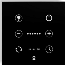
Contrôleur mural noir pour ventilateur DC avec lumière dimmable