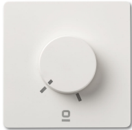
Contrôleur mural rotatif blanc applique RF 6 vitesses