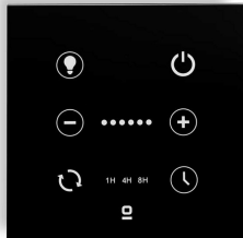
Contrôleur mural noir pour ventilateur DC avec lumière dimmable