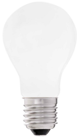
Ampoule A60 MAT LED E27 8W 2700K 640Lm