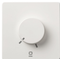
Contrôleur mural rotatif blanc applique RF 6 vitesses