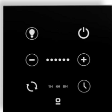
Contrôleur mural noir pour ventilateur DC avec lumière dimmable