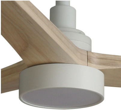
TAKI Kit lumière blanc SWT 20W dimmable