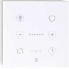
Contrôleur mural blanc pour ventilateur DC avec lumière dimmable