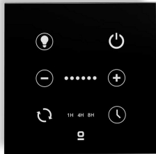
Contrôleur mural noir pour ventilateur DC avec lumière dimmable