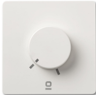
Contrôleur mural rotatif blanc applique RF 6 vitesses