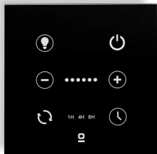
Contrôleur mural noir pour ventilateur DC avec lumière dimmable