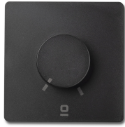
Contrôleur mural rotatif noir applique RF 6 vitesses