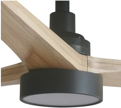
TAKI Kit lumière noire SWT 20W dimmable