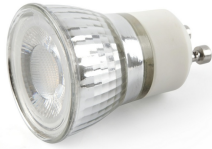
Ampoule MR11 GU10 3W 2700K 38° Verre