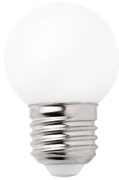
Ampoule G45 MAT LED E27 4W 2700K 450LM