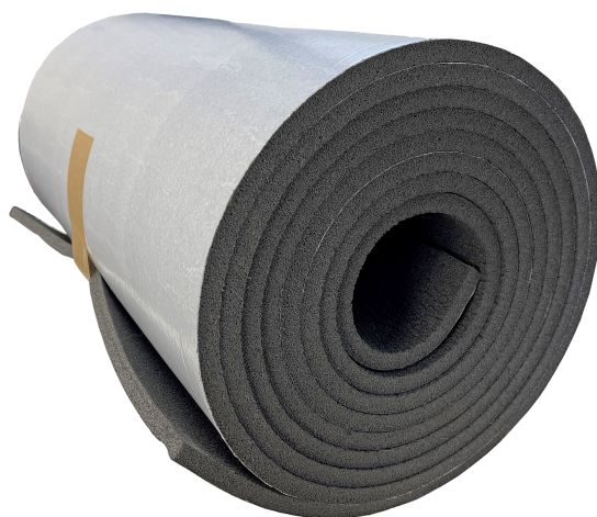
Conditionnement du POLYROL