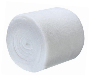
Filtre qualité G3 - 16 mm en rouleau de 5 mètres x 1 mètre