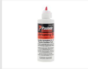
Eurocode 401482 HUILE IMPULSE