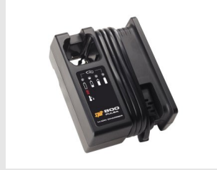
Eurocode 018482 CHARGEUR PULSA 800