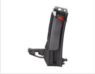
Eurocode 014623 ENS. MAGASIN 20 CLOUS P800