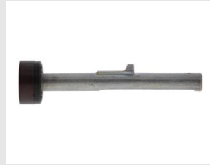
Eurocode 014641 ENS. PORTE RONDELLE P800P