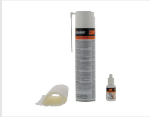
Eurocode 013690 KIT DE NETTOYAGE IMPULSE / PULSA