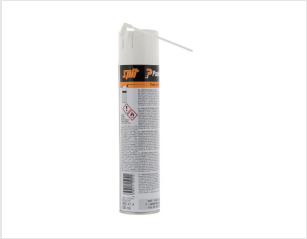
Eurocode 115251 NETTOYANT IMPULSE 300 ML