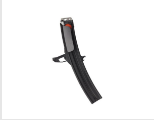
Eurocode 014640 ENS. MAGASIN 50 CLOUS P800