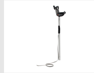
Eurocode 018820 PERCHE PULSA 800 E-LIFT 178cm