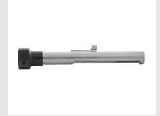
Eurocode 014642 ENS. GUIDE TAMPON MAGNET P800E