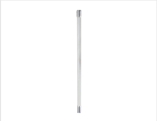
Eurocode 018849 RALLONGE PERCHE PULSA 800 E-LIFT 75cm