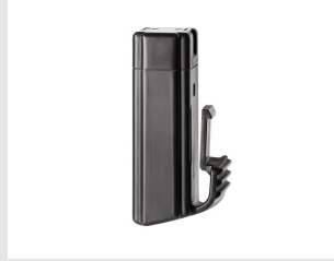
Eurocode 018483 BATTERIE PULSA 800