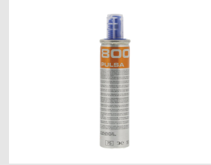
Eurocode 011773 BLISTER 2 CARTOUCHES GAZ P800