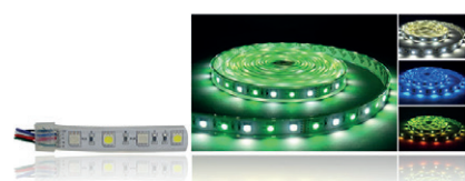
CONTRÔLEUR POUR BANDEAU LED RGB ET RGB +W