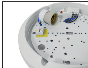
Connecteur rapide double entrée