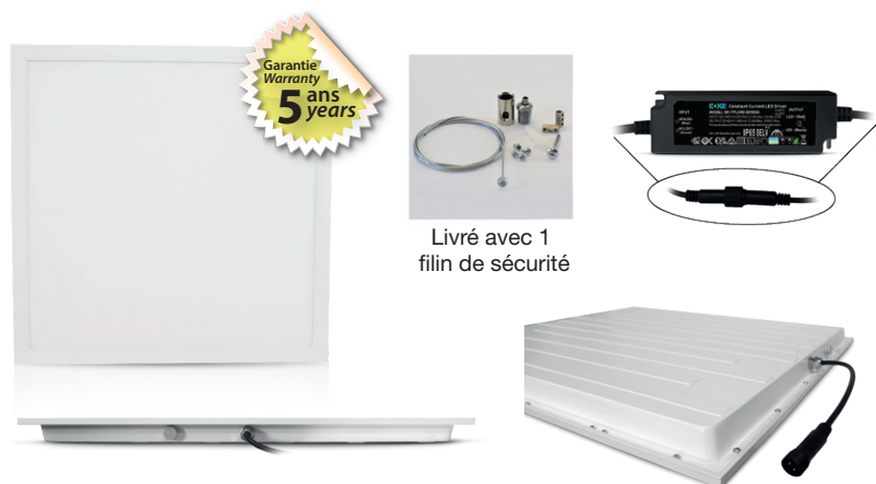
Livré avec 1 filin de sécurité

Ne pas débrancher l'alimentation côté luminaire quand l'alimentation est sous tension.