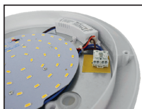
Connecteur rapide double entrées