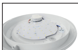
Connecteur rapide double entrée