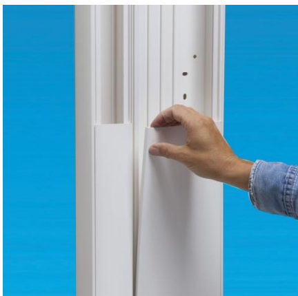
Déclipser le couvercle du côté cloison de goulotte...