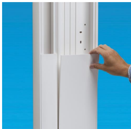
Déclipser le couvercle côté flanc de goulotte...