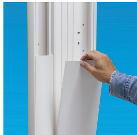
Tirer pour retirer le couvercle