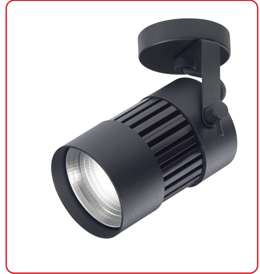
ALBA S projecteur