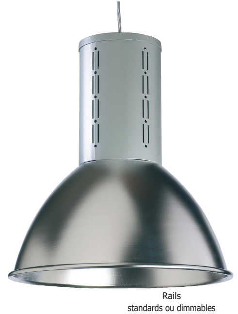
Rails standards ou dimmables