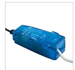
capot à clipsage rapide