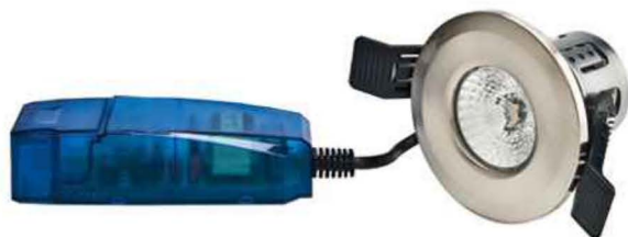
ENCASTRE LED'UP ECO 8W - ALU BROSSE